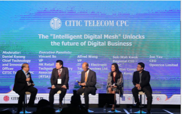
專題討論推動大講熱門新詞 IDM ( Intelligent Digital Mesh )